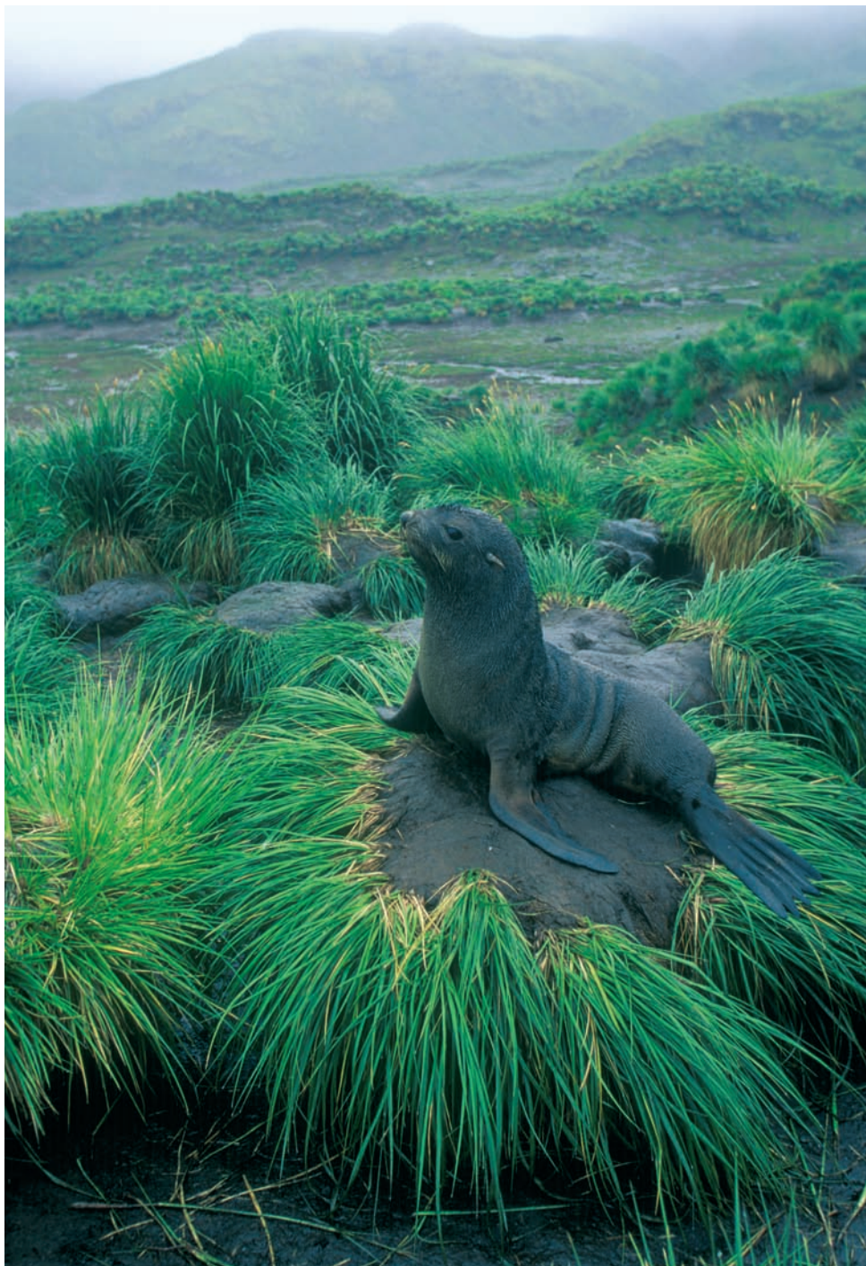
Foto 3.7: Lobo marino antártico ( Arctocephalus gazella ). El éxito reproductor de este otárido se halla condicionado por los cambios que se producen en el clima y en la cantidad de krill.