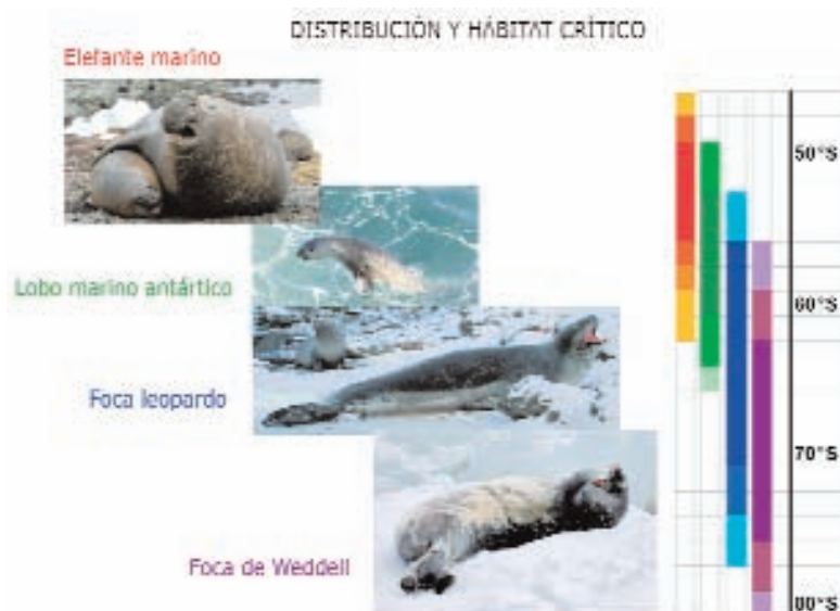
Figura 3.2: Variación latitudinal de la distribución de focas y lobos marinos antárticos

En la figura, cada color representa a una especie, y la variación de tono en la escala latitudinal de la derecha indica la variabilidad en su distribución sur-norte; los colores más intensos equivalen al centro de su distribución, y los menos intensos corresponden a los límites de ésta. La foca de Weddell es el pinnípedo más adaptado al hielo y el más resistente a condiciones extremas. El lobo marino antártico es el menos adaptado al hielo y necesita superficies libres de éste para la cría.