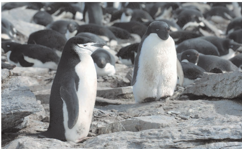
Foto 3.9: Pingüinos de Adelia (derecha) y barbijo (izquierda). Ambas especies crían en islas antárticas, en algunos casos con su congénere, el pingüino papúa. La disminución de la extensión y cobertura del hielo marino les afecta, alterando su hábitat de reproducción y la disponibilidad de alimento durante la cría.