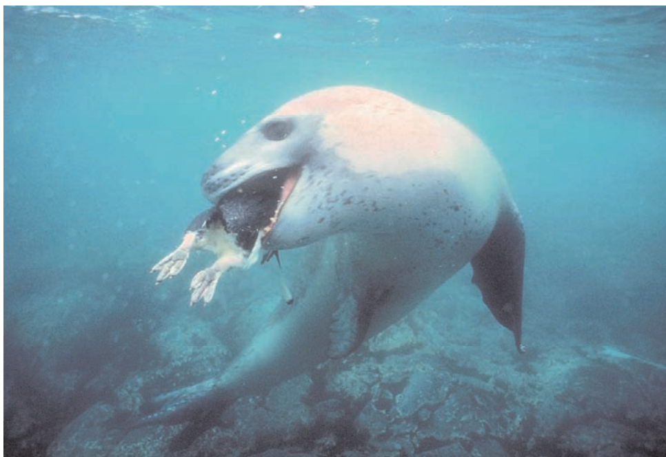
Foto 3.8: Foca leopardo ( Hydrurga leptonyx ). Esta foca es el mayor y más eficaz predador presente en aguas antárticas, lo que la sitúa en la cúspide de la cadena alimentaria. Entre sus presas figuran crías de otras focas y pingüinos. La foto muestra el momento en que una foca leopardo captura, bajo el agua, un pingüino de Adelia.

cambiar de presas en función de su disponibilidad, lo que en principio la haría menos sensible a cambios climáticos que disminuyan la abundancia de alimento. Sin embargo, en épocas en que las anomalías climáticas reducen la extensión del hielo marino también desciende considerablemente para las focas leopardo la disponibilidad tanto de krill antártico como de sus múltiples depredadores, ya que estas condiciones alteran significativamente las redes tróficas. Además, la foca leopardo tiene una época de dispersión después del periodo reproductor que está asociada a los cambios ambientales de origen climático (Jessopp et al. 2004), por lo que en años de elevadas temperaturas marinas y menor cobertura de hielo se altera la fase dispersiva y baja cuantiosamente el número de focas leopardo que viajan a las colonias reproductoras de pingüinos y lobos marinos de islas antárticas y subantárticas. Estas condiciones están asociadas a una menor abundancia de krill para los pingüinos en las colonias de cría (Fraser y Hofmann 2003) y parecen indicar también que hay menos alimento disponible para las focas leopardo.