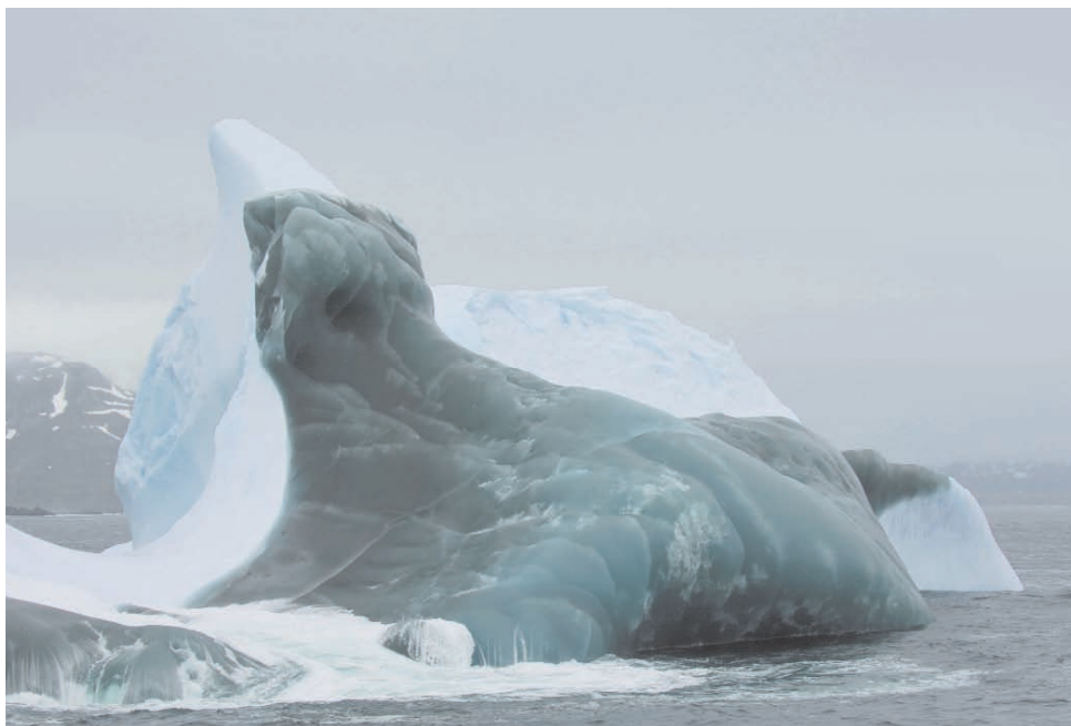
Foto 3.2: Un iceberg a la deriva, en el que se observan los distintos tipos de hielo formados durante diferentes etapas. La compresión del hielo y el aporte de minerales generan coloraciones diversas.

El continente antártico está cubierto de hielo, situado sobre el medio terrestre, incluido el fondo del mar cuando está helado, y sobre el medio pelágico, formando plataformas. Las plataformas de hielo son dinámicas, ya que varían en extensión, grosor y cohesión a lo largo del año. De éstas se desprenden los icebergs, que van a la deriva con las corrientes marinas (foto 3.2). Más allá de las plataformas de hielo se encuentra el hielo marino creado por congelación de la superficie del mar con las bajas temperaturas del invierno antártico. Tanto las plataformas como el hielo marino resultan sensibles a pequeños cambios de temperatura. Por eso, los efectos más importantes del calentamiento global sobre la megafauna, mediados