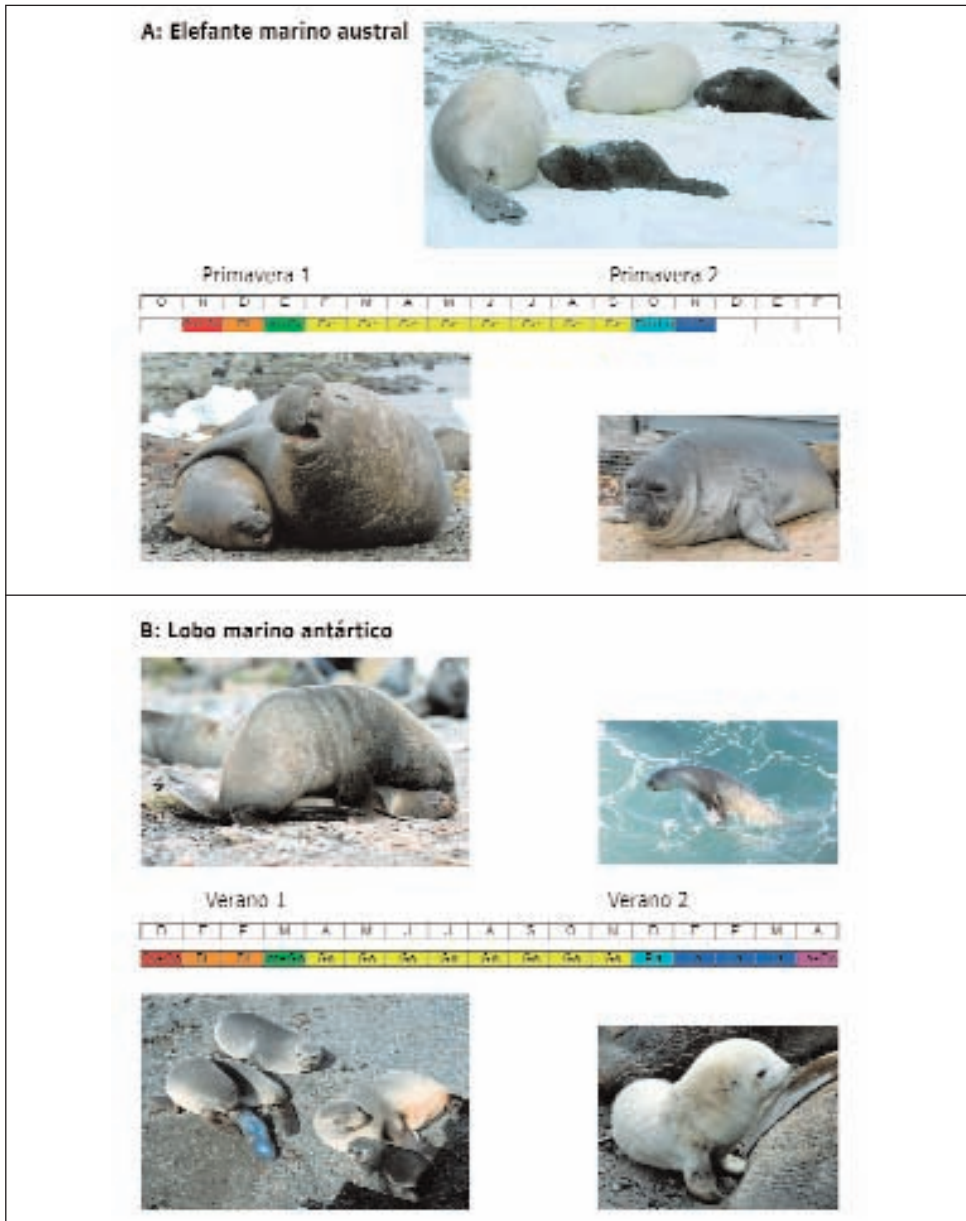
Figura 3.1: Estrategias reproductivas de los pinnípedos antárticos

A: En el elefante marino austral, la lactancia de las crías depende del almacenamiento de reservas lipídicas, acumuladas por las madres lejos de las zonas de reproducción. B: En el lobo marino antártico, la cría y lactancia son simultáneas a la obtención de comida por parte de las madres, que dependen del alimento cercano a las zonas de reproducción; esto, junto con una lactancia más prolongada, las hace más vulnerables a la disminución de recursos debida a los efectos del calentamiento. Ciclo reproductor: Ov: ovulación; Oe: estro; Di: diapausa; Im: implantación del embrión; Ge: gestación; Pa: parto; La: lactancia; De: destete.