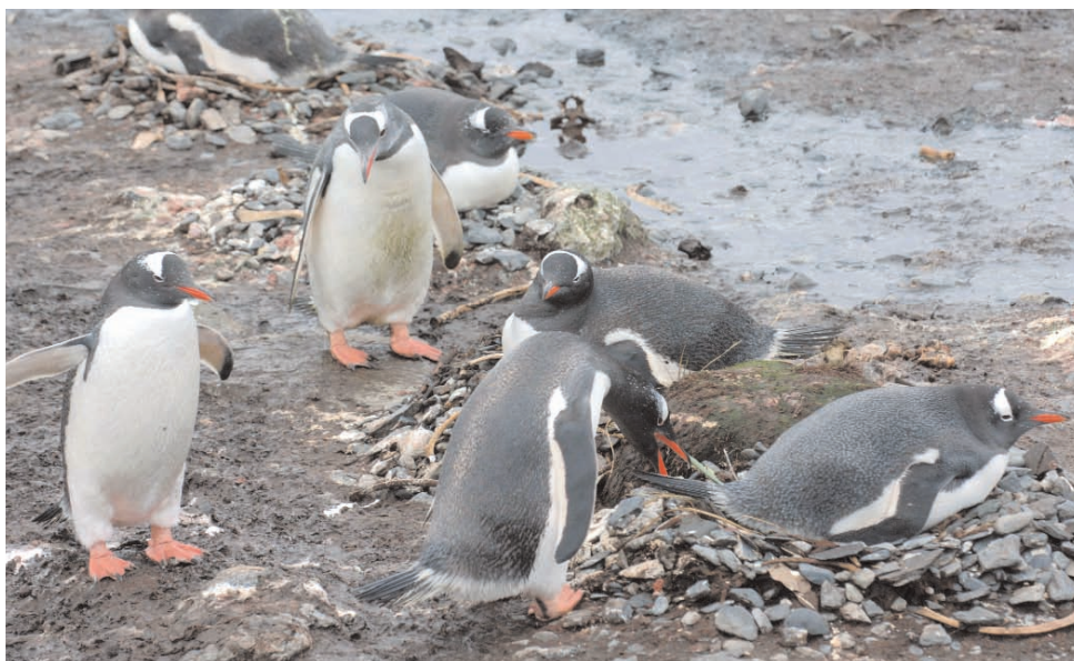
Foto 3.10: Pingüinos papúa, una de las especies que posiblemente se beneficien de los efectos del calentamiento en algunas regiones. Aunque el hábitat de cría del pingüino papúa aumenta al retroceder el hielo marino como consecuencia del calentamiento, éste también modifica el ecosistema marino y disminuye la disponibilidad de su alimento.