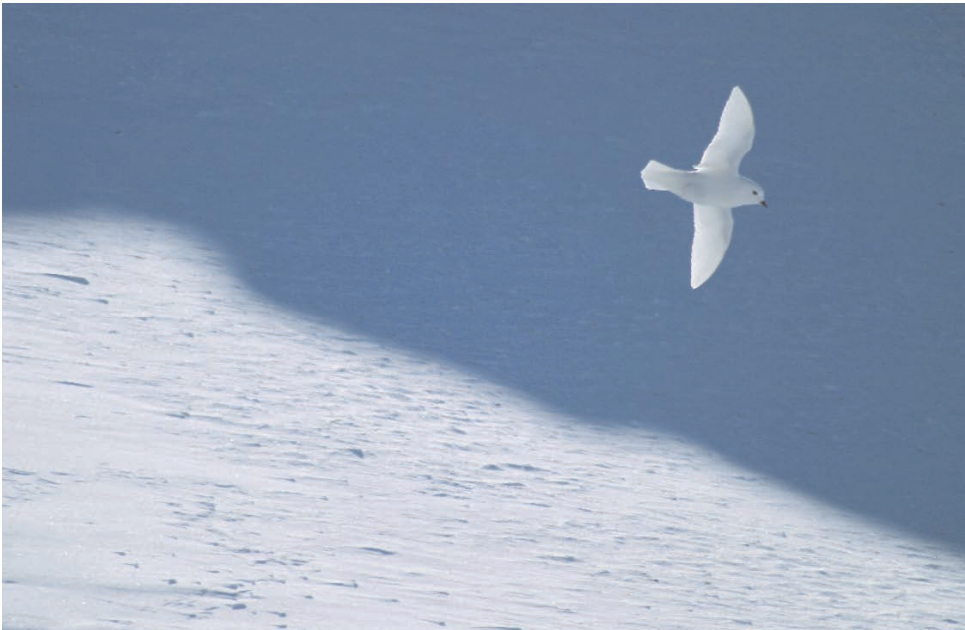
Foto 3.6: Petrel de nieve ( Pagodroma nivea ). Estas aves marinas crían en zonas permanentemente heladas alejadas del mar, por lo que deben desplazarse cientos de kilómetros para encontrar el krill, principal alimento con que ceban a sus pollos.

De entre los pingüinos antárticos, el de Adelia ( Pygoscelis adeliae ) y el emperador ( Aptenodytes forsteri ) son los más afines al hielo. El pingüino emperador es uno de los vertebrados antárticos más adaptados al hielo, capaz de sobrevivir a temperaturas inferiores a -50 °C durante las tormentas del invierno, en uno de los ambientes más extremos y hostiles del planeta. Presenta uno de los ciclos reproductores más largos, que empieza en marzo, durante el invierno, y finaliza en diciembre, durante el verano. La cría tiene lugar en el hielo marino de rápida formación, que es el que solidifica en invierno sobre el mar y rompe en verano. Durante la incubación y eclosión de su único huevo, así como en las primeras semanas de vida del pollo, los machos resisten más de tres meses sin alimento, expuestos a temperaturas extremas, y llegan a perder hasta el 45% de su peso corporal. Durante este periodo, las hembras se alimentan en el mar, principalmente de peces. Estudios sobre esta especie en el sector índico del océano Antártico indican