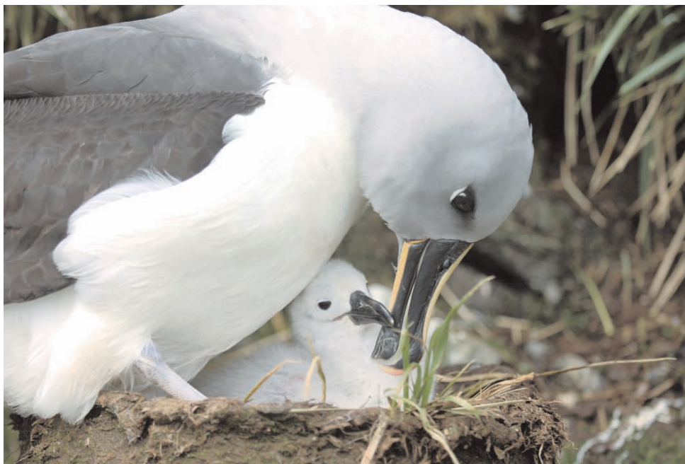
Foto 3.5: Un albatros de cabeza gris ( Talassarche chrysostoma ) cebando a su polluelo en Georgia del Sur, tras un largo viaje en busca de alimento

En otras especies de petreles, como el petrel de nieve ( Pagodroma nivea ) (foto 3.6), la dependencia del hielo limita el acceso al alimento. Este petrel nidifica estrictamente en zonas cubiertas de hielo o nieve, a veces situadas a centenares de kilómetros de distancia de su fuente principal de alimento, el krill. Para nutrir a sus pollos, los padres deben recorrer estas distancias frecuentemente, con lo que invierten gran cantidad de energía en viajar. Dada la relación del krill con el hielo marino, el petrel de nieve se ve afectado en años en los que el hielo retrocede significativamente y reduce la disponibilidad de krill y de otro tipo de recursos dependientes del hielo (Jenouvrier, Barbraud y Weimerskirch 2005). Como la