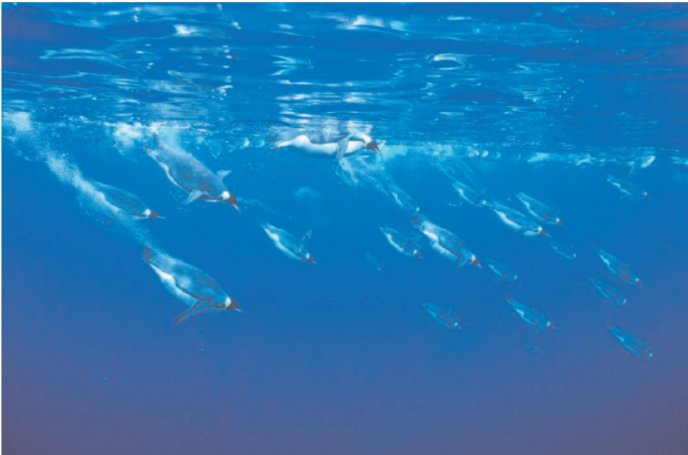
Foto 3.4: Pingüinos emperador ( Aptenodytes forsteri ) buceando. Se trata de los vertebrados mejor adaptados a las inhóspitas condiciones de la Antártida, hasta el punto de ser los únicos pingüinos capaces de soportar el invierno en estas latitudes, con temperaturas de hasta -50^{\circ}\text{C} .

En la megafauna hay grupos de especies que dependen del medio terrestre para completar su ciclo vital, como los pinnípedos (focas y lobos marinos) y las aves marinas (principalmente pingüinos, albatros y petreles), y especies exclusivamente acuáticas, como los cetáceos. De entre estos grupos, no todas las especies evolucionaron y se adaptaron a ambientes antárticos del mismo modo, ni durante el mismo periodo geológico, y, por tanto, lo hicieron en un contexto ecológico distinto. La variación en los valores de diferentes parámetros biológicos (edad de maduración sexual, fecundidad, crecimiento y tasa de supervivencia) como respuesta a ambientes extremos resulta específica para cada especie, y esta variación