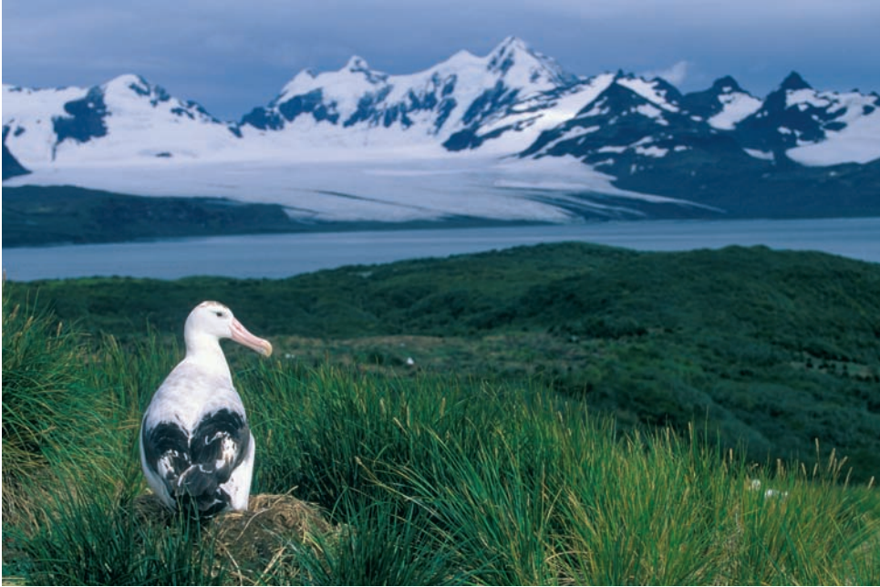
Foto 3.11: Albatros viajero ( Diomedea exulans ). Es el ave marina de mayor envergadura y una de las que presentan un ciclo reproductor más largo, por lo que la cría tiene una periodicidad bianual. Durante la reproducción, puede llevar a cabo desplazamientos de hasta cientos de kilómetros y varios días de duración en busca de alimento antes de regresar al nido para cebar a su único pollo.

especiales de Naciones Unidas que han desarrollado programas de observación para evaluar los daños de estas pesquerías y promovido el uso de mecanismos de exclusión y reducción de capturas incidentales—, la FAO considera que muchos países todavía no han conseguido afrontar satisfactoriamente el problema. Además, la merluza chilena es una especie objetivo de pesquerías ilegales, muchas de ellas con barcos de bandera de conveniencia, para las cuales las capturas incidentales sólo suponen una molestia y un trastorno, no un problema de conservación por el que parezcan interesarse. Los albatros que nidifican en Georgia del Sur son especialmente sensibles a estas pesquerías, y sus poblaciones se citan entre las más amenazadas del mundo. Para algunas de estas especies, en particular el albatros de cabeza gris y el de ceja negra, los efectos del calentamiento sobre la disminución de su alimento constituyen un grave problema añadido para su éxito reproductor.