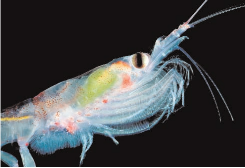
Foto 3.3: Krill ( Euphasia superba ). La disminución del krill por efecto del calentamiento está teniendo un negativo impacto en cascada en muchas de las especies predatoras que integran la comunidad de grandes aves y mamíferos marinos antárticos.

Dada su gran densidad en el océano Antártico, los crustáceos desempeñan un papel fundamental en la estructuración y función de las redes tróficas marinas (Smetacek y Nicol 2005; Murphy et al. 2007), especialmente los eupasiáceos (el krill), de los cuales las principales especies tienen ciclos de vida ligados a los ciclos estacionales del hielo marino. El krill antártico es muy abundante y se distribuye desde el hielo marino hasta el medio oceánico, por lo que constituye el alimento más importante para peces, calamares, aves y mamíferos marinos. En el hielo, sobre todo durante su estado larvario, el krill encuentra algas de las que alimentarse y refugio frente a depredadores (Smetacek y Nicol 2005). Debido a esta dependencia del hielo, probablemente el krill sea uno de los grupos más afectados por las consecuencias del calentamiento global. Este cambio climático también repercute, indirectamente, sobre los principales depredadores del krill, para los que resulta difícil localizar otra fuente tan copiosa de alimento. Estos impactos cobran una relevancia más grande en las regiones donde el krill es abundante y el retroceso del hielo mayor.